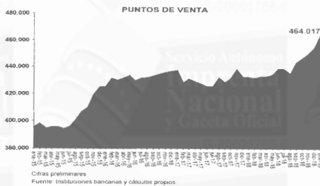
ANEXO N° 4 NÚMERO DE POS Y NEGOCIOS AFILIADOS

SIMÓN ALEJANDRO ZERPA DELGADO Ministro del Poder Popular de Economía y Finanzas Decreto N° 8.126 de fecha 26 de octubre de 2017 G.O.R.B.V. N° 41.265 de fecha 26 de octubre de 2017