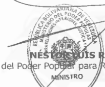
NÉSTOR LUIS REVEROL TORRES Ministro del Poder Popular para Relaciones Interiores, Justicia y Paz

Comuníquese y publíquese. Por el Ejecutivo Nacional,