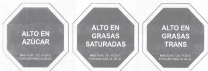
Diagrama N° 1. Figura octagonal a implementar en el etiquetado de alimentos manufacturados con alto contenido de azúcares añadidos, grasas saturadas y grasas trans.

Artículo 7. El rotulado establecido en el artículo 6 de la presente Resolución, así como el establecido en el artículo 7 de la Resolución N° 011 publicada en la Gaceta Oficial de la República Bolivariana de Venezuela N° 41.804 de fecha 21 de enero de 2020, deberá cumplir con las siguientes condiciones: