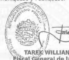
TAREK WILLIAMS SAAB Fiscal General de la República