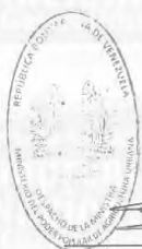
GABRIELA MAYERLING PEÑA MARTINEZ MINISTRA DEL PODER POPULAR DE AGRICULTURA URBANA

Comuníquese y Publíquese. Por el Ejecutivo Nacional,