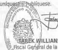
TAREK WILLIAMS SAAB Fiscal General de la República